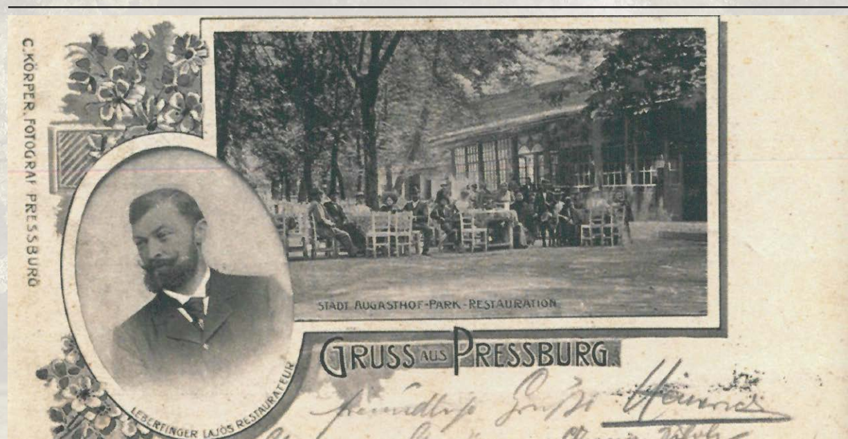
Historická pohľadnica – terasa Leberfingeru