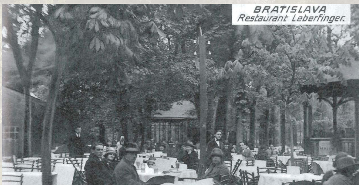
Historická fotografia – terasa Leberfingeru.