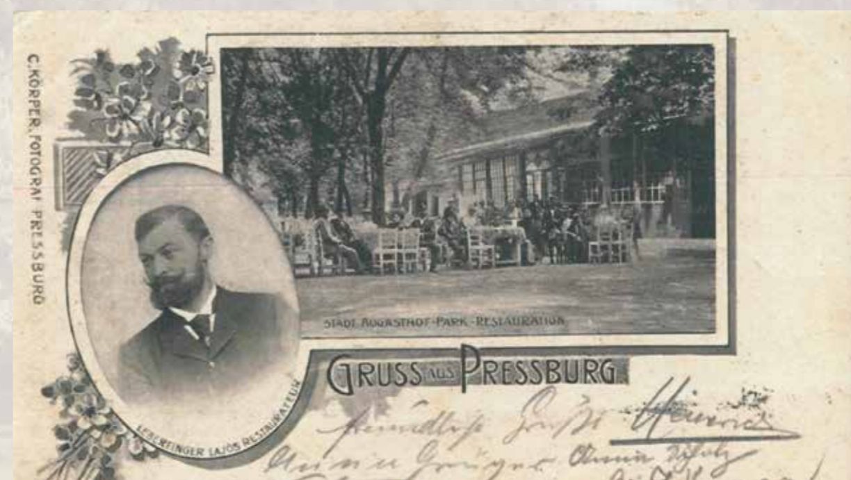
Historická pohľadnica – terasa Leberfingeru