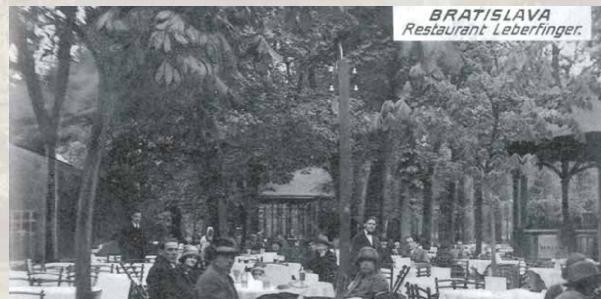
Historick  fotografia – terasa Leberfingeru.