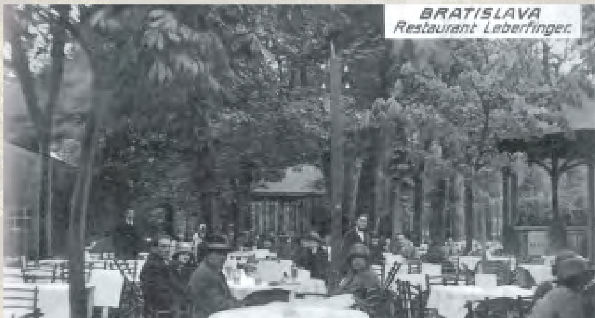
Historická fotografia – terasa Leberfingeru.