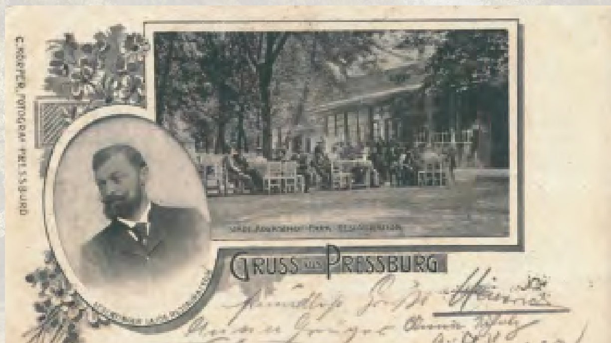
Historická pohľadnica – terasa Leberfingeru